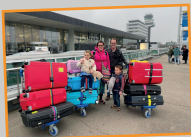
Klaar voor vertrek op Schiphol