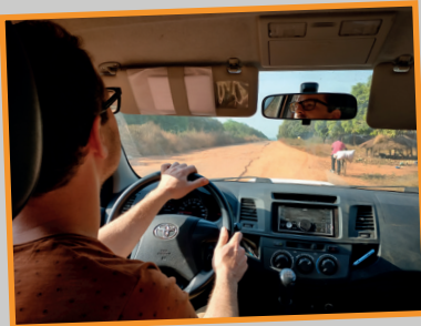
Onderweg van Bissau naar Buba, rijden we het grootste gedeelte naast de asfalt weg vol gaten.