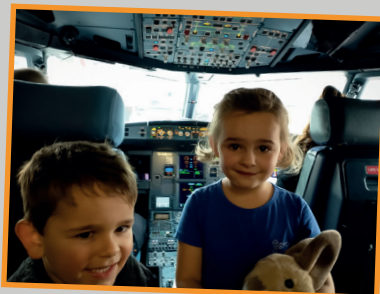
Bofkezen in de cockpit!