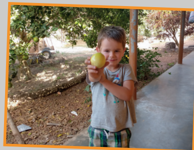
Moet je deze lekkere passievrucht eens zien!