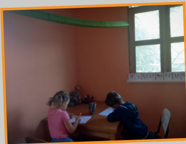
Jannafien en Jan-Onno op school

kopen, zoals een heerlijke watermeloen die in de hoofdstad verkrijgbaar is en niet in Buba. Hele belevenissen! Aan het einde van de middag werd de auto vol gepakt met onder andere onze 7 koffers, kippen en een tafel op het dak. De 6 uur durende reis naar Buba kon beginnen! (238km) Hobbelen we op sommige plekken nog langzamer dan stapvoets kuilen proberen te ontwijken. Een groot gedeelte naast de asfaltweg vol gaten rijdend, omdat de grond ernaast fijner rijden is dan de diepe scherpe gaten in het asfalt. Lemen hutjes met golfplaten of rieten daken, vrouwen met grote schalen met allerlei spullen op hun hoofd, kinderen water puttend, geiten boven op de taxibusjes gebonden, een koeienjongen die met een kapmes in zijn hand het vee de weg over laat steken. Kinderen roepend en wijzend naar de auto: "Branku minus!!" (blanke kinderen!!) Maar ook kinderen die verschrikt weggrennen... want stel je voor dat die blanken ons meenemen! En zo kwamen we 6 uur later aan op de compound in Buba, waar we blaffend door de drie honden werden onthaald, eindelijk op de plek wat ons nieuwe thuis wordt!