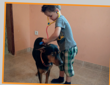
We werken over de dierenarts. Soms komt er een van de (waak)honden het klaslokaal ingewandeld, dan wordt hij gelijk onderzocht.