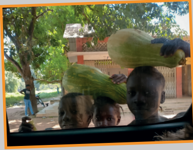
Wie zitten er in deze auto? "Branku minus!" Blanke kinderen, zijn hier echt een bezienswaardigheid.