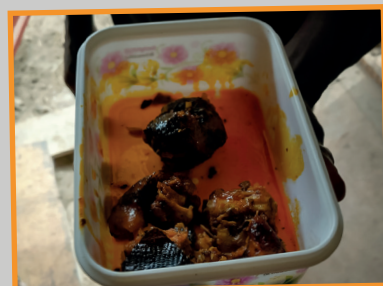
Gekookte leguaan in rode olie.